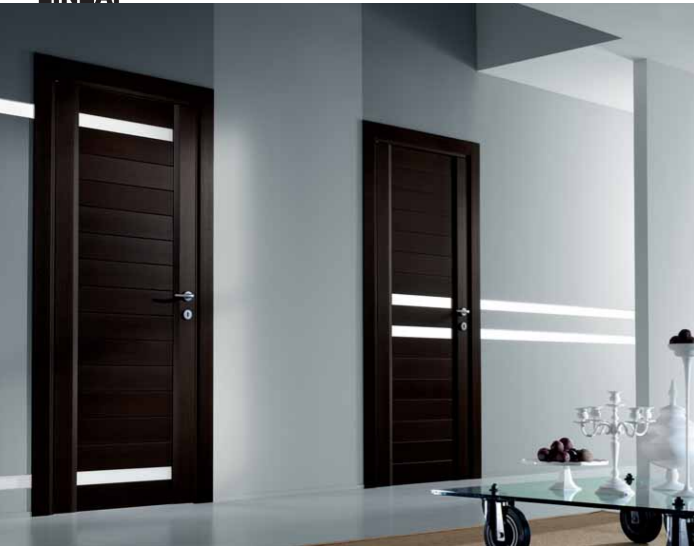
Teta V2B e Teta V2C